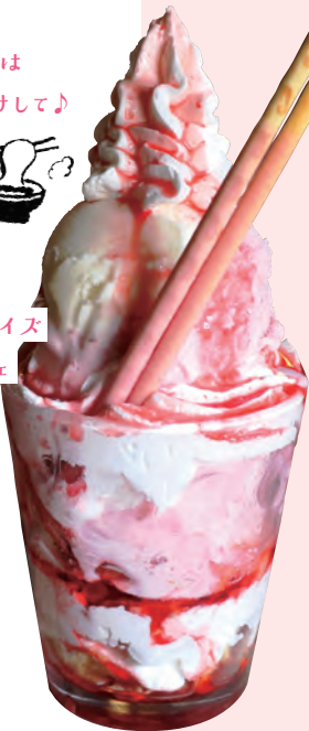
小さめパフェ (バニラ・チョコ・いちご) 450円