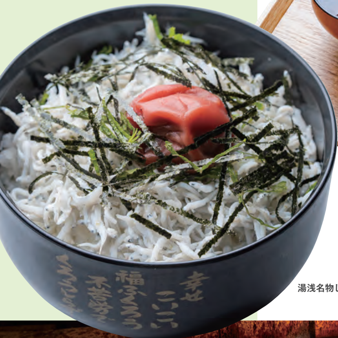
湯浅名物しらす丼 700円