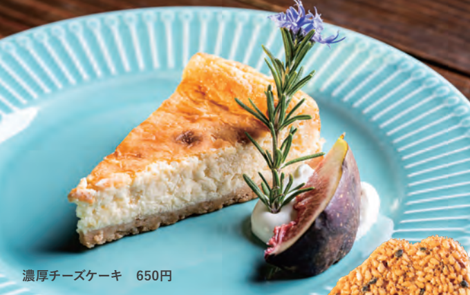
濃厚チーズケーキ 650円

自家製ジュレと果肉がたっぷりな ソフトクリームが大人気! 口の中に柑橘の爽やかな風味が広がります