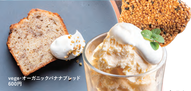
vege・オーガニックバナナブレッド 600円