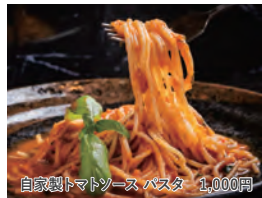
自家製トマトソースパスタ 1,000円