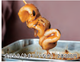
家りもあ(たまり・いなか) 2本300円