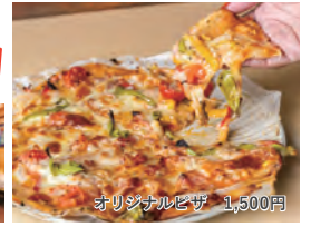
オリジナルピザ 1,500円