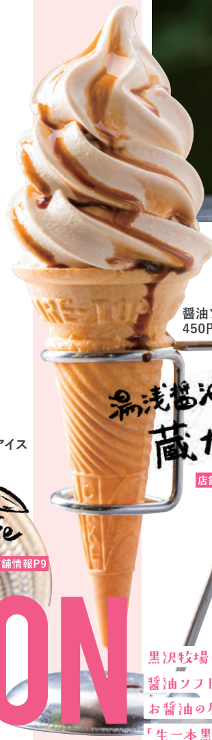
醤油ソフトクリーム 450円