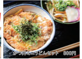
かつ丼系うどんセット 800円